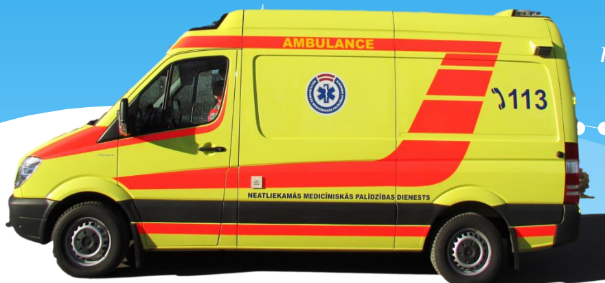
Baltijas valstīs pirmais speciāli konstruētais un aprīkotais neonatologu brigādes operatīvais transportlīdzeklis

priekšlaikus dzimušo un smagi slimu jaundzimušo bērniņu transportēšanai un specializētās neatliekamās medicīniskās palīdzības sniegšanai